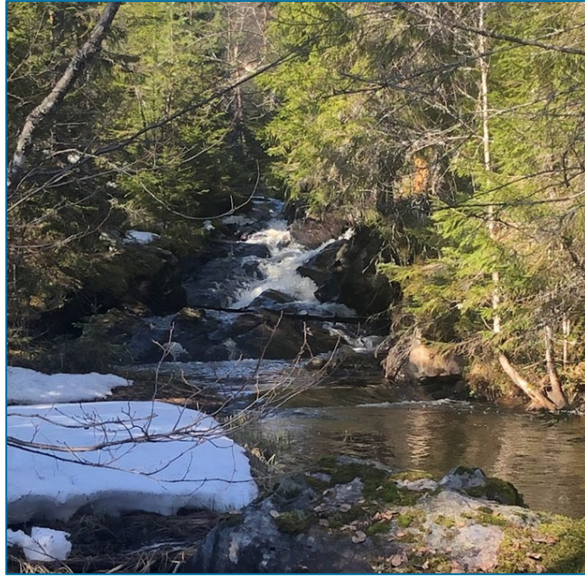
Bilde 2. Foss i fløyta