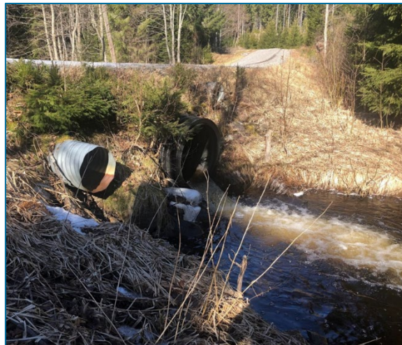
Bilde 3. Kulvert ca. 100 meter oppstrøms Åtjennet