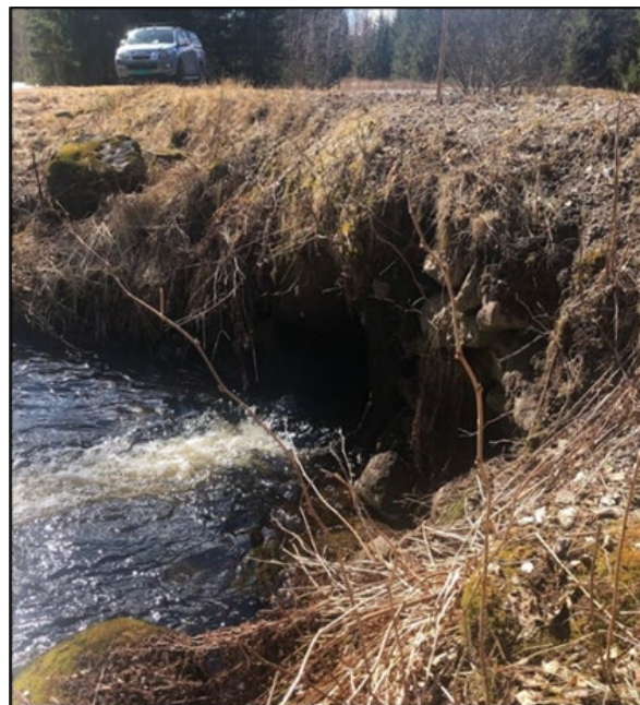
Bilde 1. Veg som krysser bekken mellom Leirsjøen og Åtjennet