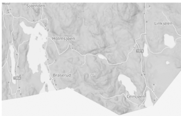
Kart 1. Ingen registrerte observasjoner av edelkreps i Artskart

Nærmeste registrerte edelkrepsbestand i Artsdatabanken er Helgesjøen (egen beredskapsplan), samt Vrangselva, Nessjøen, Ålesjøen og Langvannet