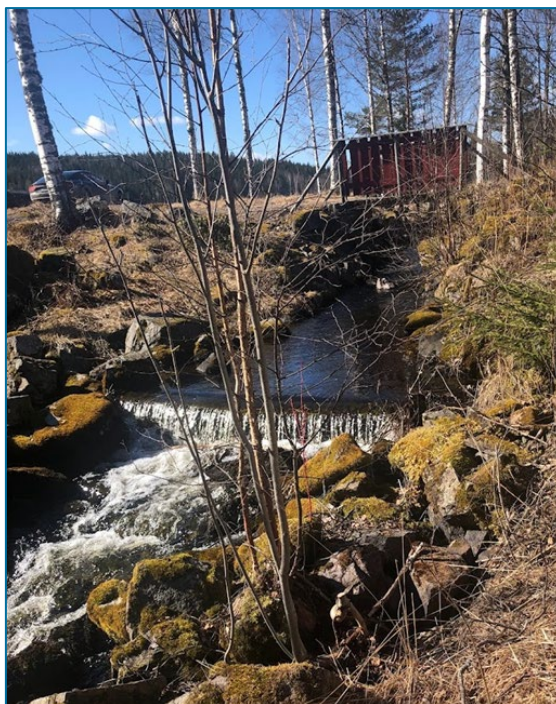
Bilde 4. Terskel like nedenfor utløpet av Holmsjøen