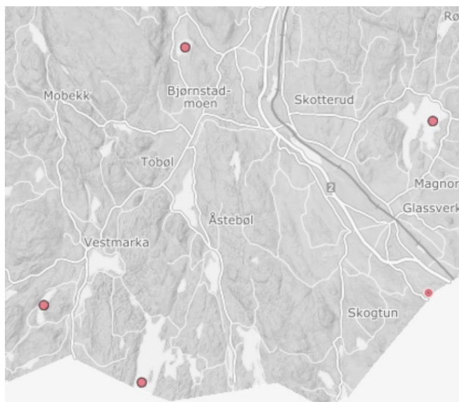
Kart 2. Observasjoner av edelkreps i Artskart i området rundt Holmsjøen, Fløyta og Leirsjøen